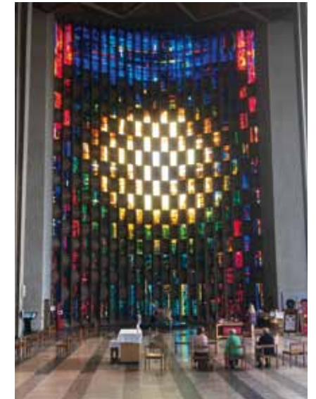
Das Tauffenster in Coventry