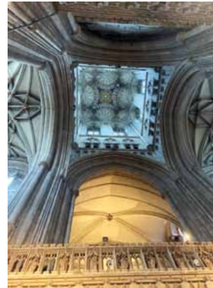
Blick in den Turm in Canterbury

Das neue Konfi-Jahr geht im September weiter, wir freuen uns darauf!